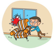
左記以外の 偶然な破損事故等