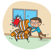
左記以外の 偶然な破損事故等