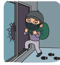
そうじょう 盗難・騒擾