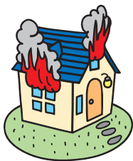
火災、落雷 破裂・爆発