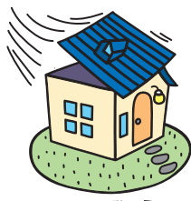
風災、 ひょう 雹災 雪災*1